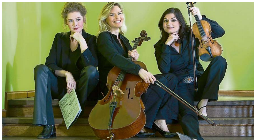
Das Zürcher Trio Artemis.