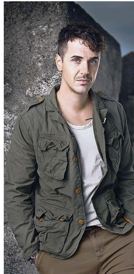
Familiäres Konzert in Aarau.

Aarau Zoo Club, Sa 13. April, ab 21 Uhr. www.delightproductions.com